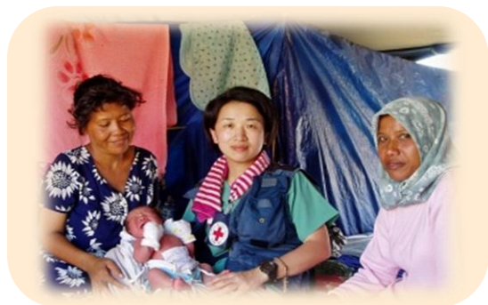
海外で活動する助産師

助産師とは英語でMidwife = with womanといい「女性とともに在る」という意味です。今でも妊娠や出産が原因で亡くなる女性があります。女性や家族が安心して新しい命を迎えられるために、高い能力を備えた助産師の活躍は世界中で期待されています。日本で資格をとってから、海外で活動する助産師も多くいます。WHO（世界保健機構）やJICA（独立行政法人国際協力機構）といった国際機関ではたらく助産師もいます。世界中で活躍できる知識・技術・人間性など助産師としての基本は、助産師教育機関で学びます。