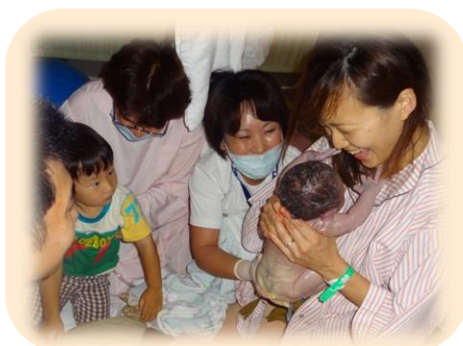
家族と共に迎えるいのちの誕生