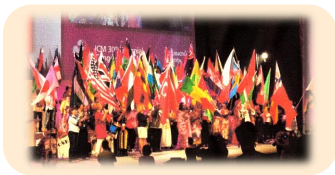
世界助産師連盟（ICM）第30回プラハ大会：2014