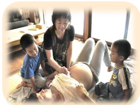
家庭訪問による妊婦健診