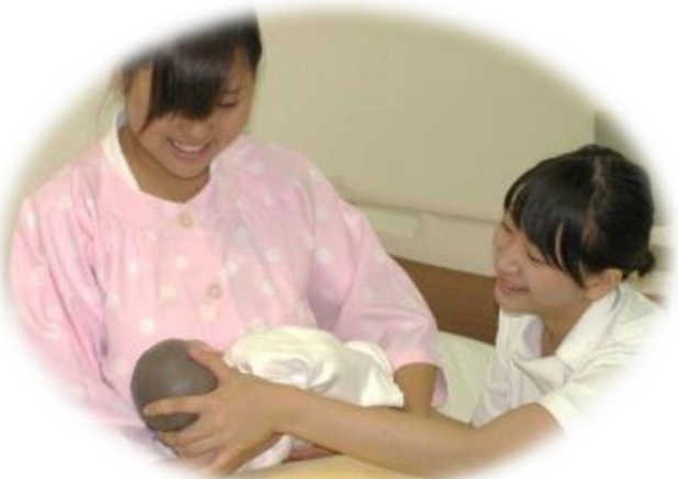
母乳育児支援演習