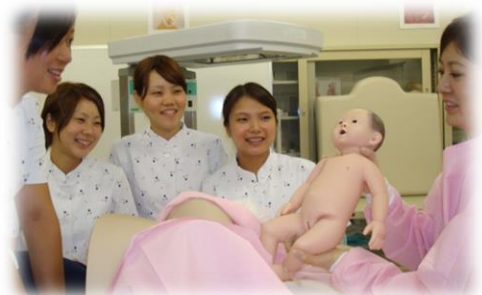
分娩介助技術演習

全国の助産師教育機関である正会員校一覧は、全国助産師教育協議会のホームページで見ることができます。