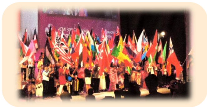
世界助産師連盟（ICM）第30回プラハ大会：2014